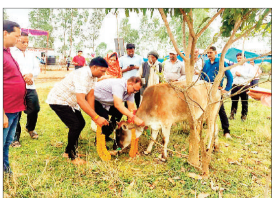
गौ-अष्टमी के दिन पूजा करते धाम के सदस्य।