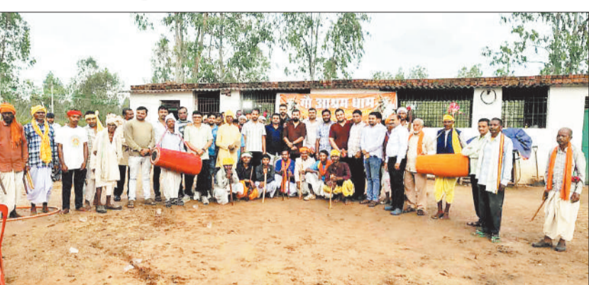
गौ आश्रय धाम में उपस्थित चार पंचायत के लोग।