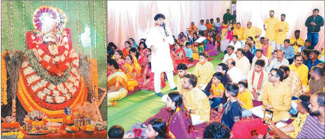
हरिभूमि न्यूज | जशपुरनगर